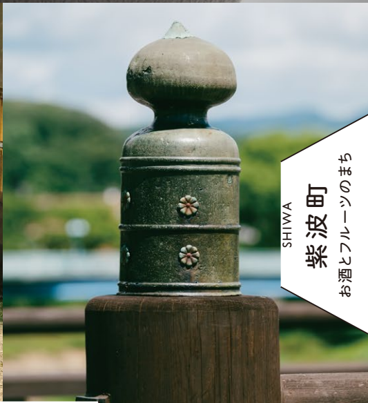
HACHIMANTAI 八幡平市 山と大自然のまち