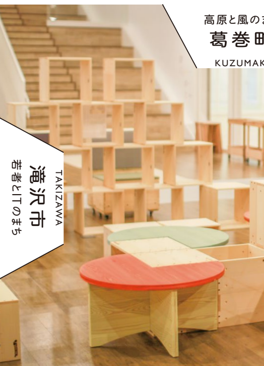
高原と風のまち 葛巻町 KUZUMAKI