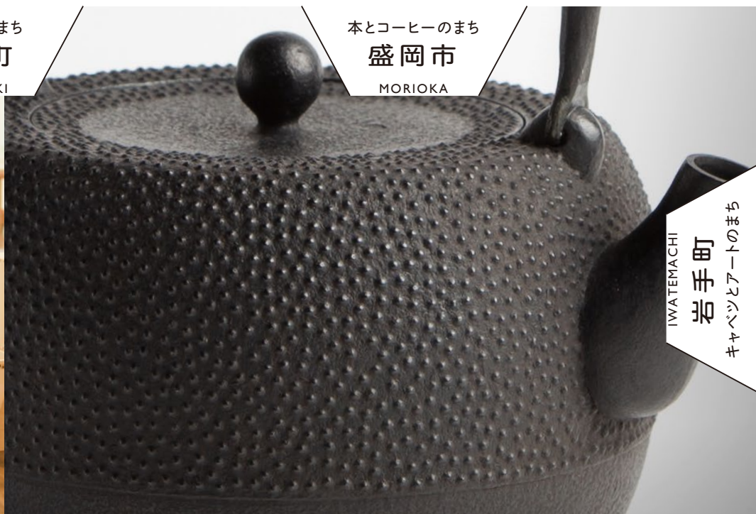
本とコーヒーのまち 盛岡市 MORIOKA