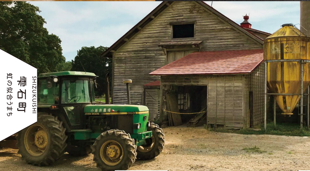
YAHABA 矢巾町 学びと医療のまち